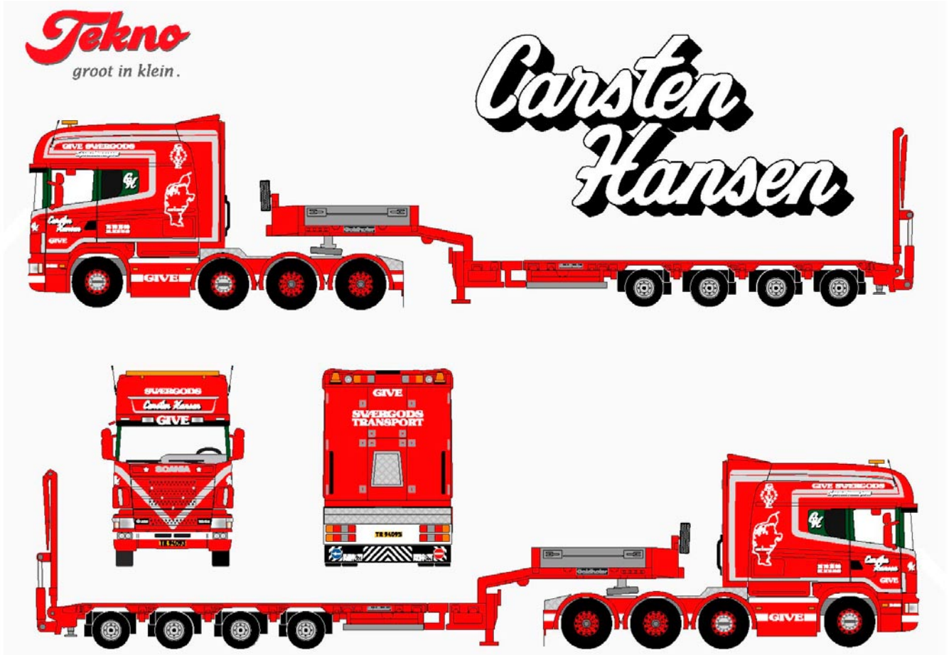
T5047Hansen , Scania Longline mit 4achs Tieflader Goldhofer Carten Hansen, Dänemark, Auslieferung Juli 2006, max. Anzahl 750 Stück Richtpreis 225,00 €uro